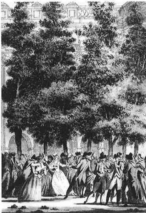
Palais Royal 10 juli 1789, door Jean-François Janinet (Musée Carnavalet, Paris)

Juist omdat Mary Wollstonecraft zulke grote verwachtingen van de Revolutie had, trof het ontsporen van die Revolutie