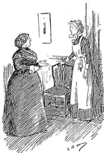
‘Verpleegstersleven begin 1900’ Ziekenverpleegster (na 48 uur gewaakt te hebben bij een patiënt): ‘Vindt u het goed als ik nu wat ga slapen, mevrouw?’ Mevrouw (verbaasd): ‘En ik dacht dat u een gediplomeerd pleegzuster was!’ Herkomst prent: zie noot 1