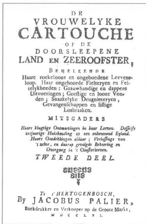
Titelpagina van De vrouwelyke Cartouche Uit: ibidem , pp. 32. Deel II.