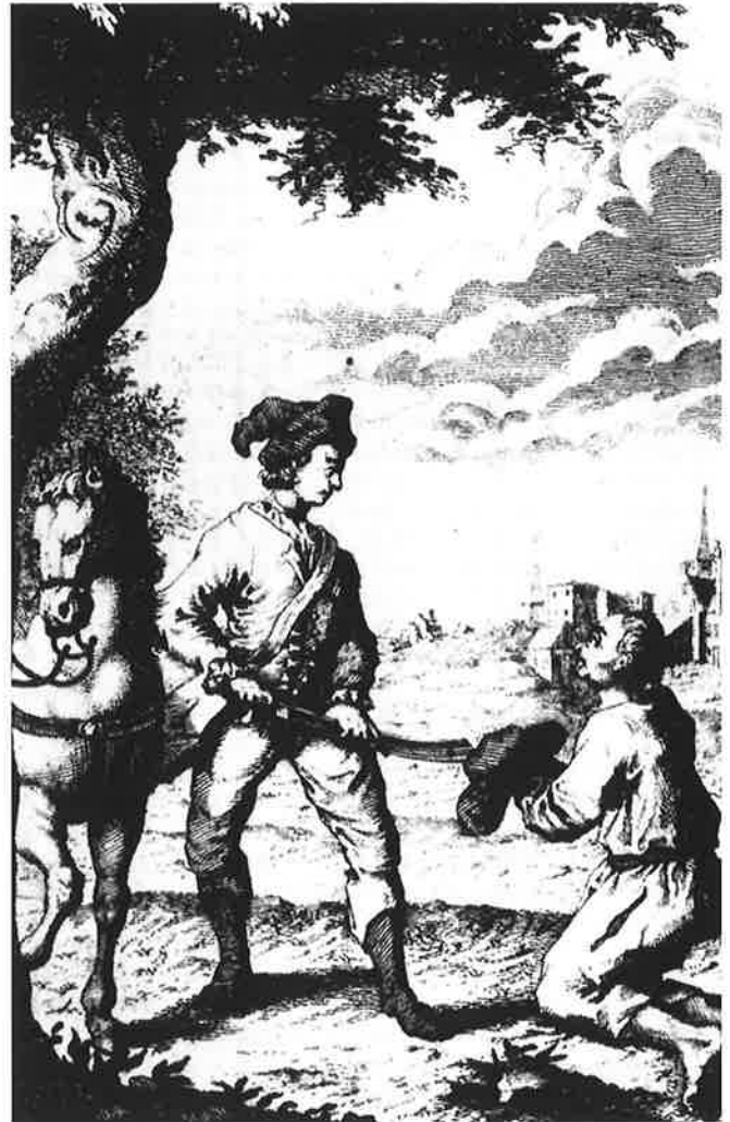
Omslag van P.L. Kersteman, De vrouwelyke Cartouche , 's-Hertogenbosch, 1756. Van commentaar en inleiding voorzien door Rudy Schreijnders. Den Haag, 1987. Deel II

Charlotta, hoofdpersoon in dit verhaal, is al op jonge leeftijd wees geworden en in huis genomen door Carlisle, een jonkvrouw. Hoewel ze een goede opvoeding geniet, komt Charlotta op het verkeerde pad terecht; ze heeft een onstuitbare drang tot stelen. Op twaalfjarige leeftijd loopt ze weg van huis en moet ze zich alleen zien te redden. Ze vindt werk als dienstmeid en raakt zwanger van de zoon des huizes. Charlotta had gedacht te kunnen trouwen, maar in plaats daarvan wordt ze weggestuurd. Haar kindje legt ze te vonde-