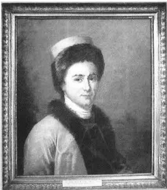
Jean-Jacques Rousseau: portrait en Arménien, par H. Liotard (1702-1788)