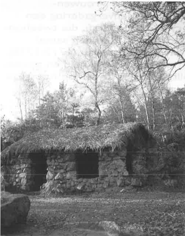
La cabane de Jean-Jacques dans le Désert d'Ermenonville

Wollstonecraft begrijpt de natuur van de vrouw in de betekenis van aanleg, dus eigenlijk in biologische zin. Het debat met Rousseau krijgt op die manier betekenis in termen van nature-nurture : met welke eigenschappen en potenties worden vrouwen geboren en welke eigenschappen zijn het resultaat van opvoeding en ontwikkeling? In mijn onderzoek heb ik deze -biologische- invulling van het natuurbegrip met betrekking tot de vrouwelijke sekse bij Rousseau, althans in verband met de opvoeding, niet kunnen bevestigen. 3 Ik vind het juist opvallend hoezeer Rousseau een pedagoog van het vormen is. Meisjes worden bij Rousseau niet geboren, maar gemaakt. Het seksespecifieke karakter van de kinderlijke ontwikkeling, zoals Rousseau die beschrijft, is terug te voeren op het verschil in opvoeding. Het is niet zo dat Rousseau ontkent dat kinderen met een bepaalde aanleg worden geboren. Maar