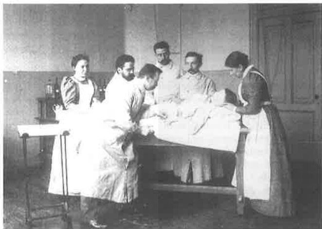
Twee lekenverpleegsters, die assisteren bij een operatie in het Emma Kinderziekenhuis te Amsterdam (1894).

De namen van de artsen zijn bekend, die van de verpleegsters niet.