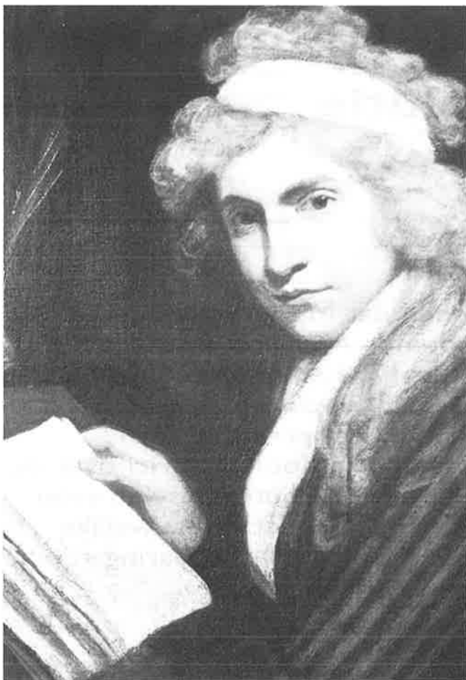
Mary Wollstonecraft, detail van een portret door John Opie (Tate Gallery, London)

moment zijn verantwoordelijkheid niet genomen heeft: als hij gebruik had gemaakt van zijn populariteit en toen een meer algemeen aanvaardbare oplossing gekozen had, had de Revolutie wellicht voorkomen kunnen worden. 3