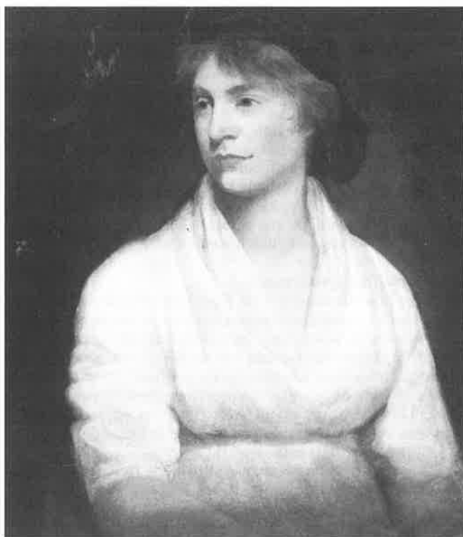
Mary Godwin (geboren Wollstonecraft), door John Opie (National Portrait Gallery, London)

Beslissend voor het moment van uitbreken van de Revolutie is voor haar het besluit om de Staten-Generaal bijeen te roepen, en wel op de manier zoals dat in 1614 voor het laatst was gebeurd, dus niet meer in overeenstemming met de maatschappelijke realiteit. Ze verwijt Necker dat hij op dat